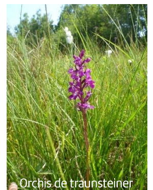
Orchis de Traunsteiner