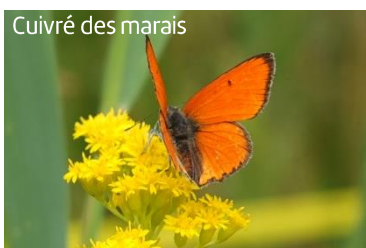
Cuivré des marais

Elles présentent enfin un intérêt paysager certain.